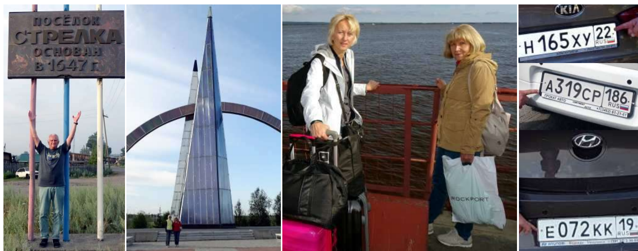
Рис. 3.184. 2019 год. Слева направо: 1) посёлок Стрелка (см. рис. 3.175) около впадения Ангары в Енисей (переправлялись к этому месту через Енисей на пароме, после чего ездили в город Новоангарск на берегу Ангары); 2) Полярный круг в Салехарде; 3) по Оби из Салехарда в Лабитнанги; 4) номера наших арендованных машин в России мы не выбирали (они оказались ХУ, СР и КК; все машины были неплохими)

впадением в реку Обь. В городе Мариинск (Кемеровской области) производят известную водку «Белуга», которая является одной из лучших (и самых дорогих) в России. Интересным был подъём канатной дорогой Горного Алтая в районе Манжерокского озера.