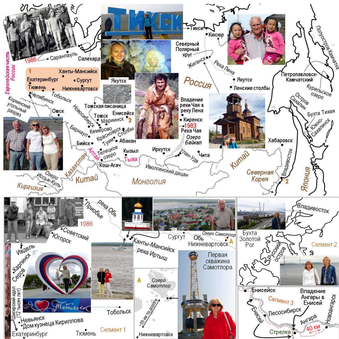
Рис. 3.175. Карта некоторых мест, посещённых в азиатской части России. В нижней части карты увеличены области сегментов 1, 2, 3 и А

В этой подсекции приводятся некоторые фотографии с минимальными комментариями. На рис. 3.175 показана карта, на которой указаны места и районы фотографирования.