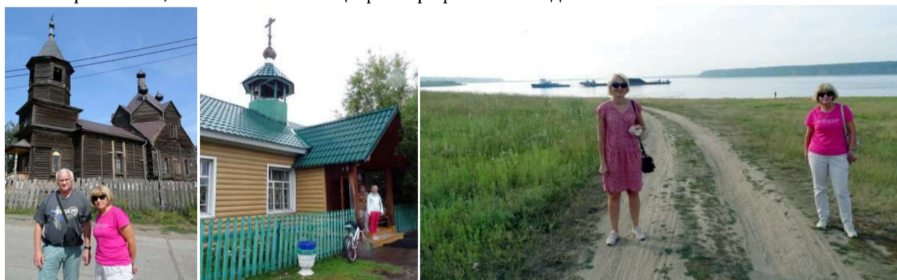
Рис. 3.185. Церковь деревни Барабаново в Красноярском крае (слева). Свято-Троицкий Храм в селе Казачинское Красноярского края, в котором находится мироточащая икона Казанской Божьей матери (в центре). Слияние Ангары (она справа) и Енисея (он слева) в посёлке Стрелка Красноярского края (справа)

На рис. 3.185, 3.186 показаны ещё фотографии 2019 года.