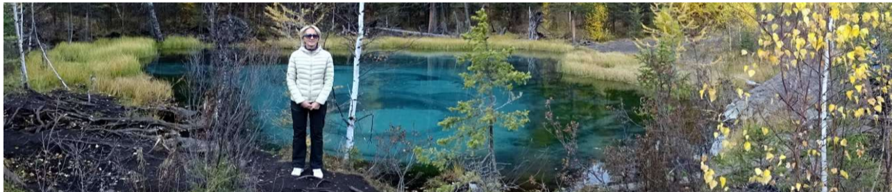
Рис. 3.179. Гейзерное озеро, Алтай, 2018 (карта показана в [9, стр. 74])