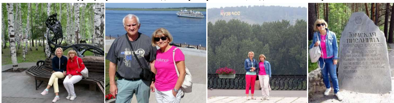
Рис. 3.183. 2019 год. Слева направо: 1) берёзовая роща в Ханты-Мансийске; 2) на берегу реки Енисей в городе Енисейск; 3) Кузбасс (город Кемерово); 4) Томская писаница (примерно в 55 км на юго-запад от Кемерово)

Места, показанные на фотографиях, можно найти на рис. 3.175. Более детальные карты есть в книге [9]. Правый верхний снимок (в сегменте 1 ) сделан в Ханты-Мансийске около памятного знака «Первооткрывателям земли Югорской». Внизу река Иртыш в 10 км перед