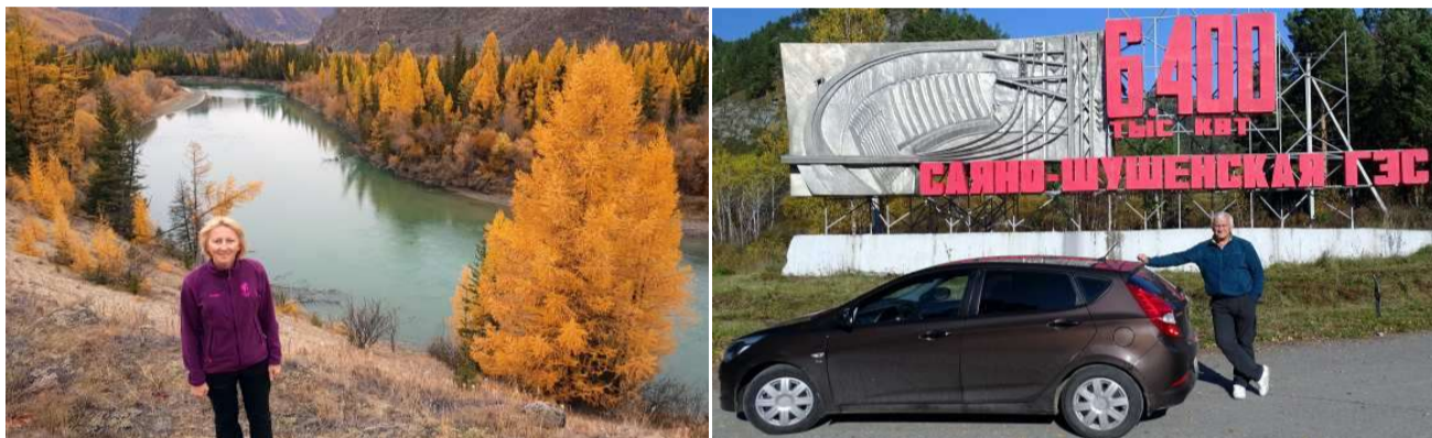
Рис. 3.182. 2018 год. Слева река Чуя (приток Катунь) на Алтае примерно в 7 км от Гейзерного озера (между посёлками Акташ и Курай). Правый снимок сделан примерно в 10 км, не доезжая Саяно-Шушенской ГЭС