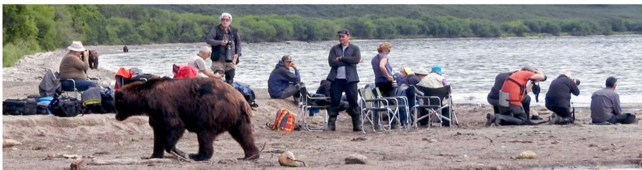
Рис. 3.178. Фотосессия иностранных туристов в бухте Северной Курильского озера на Камчатке, 2017