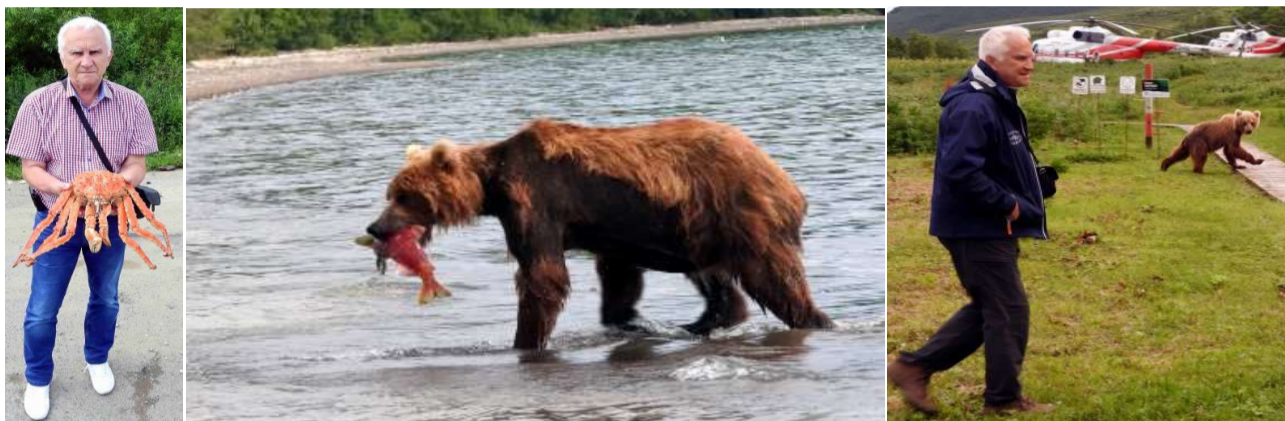
Рис. 3.177. 2017 год. Таких крабов мы покупали в районе бухты Тихая на Сахалине (слева). Медведь ловит рыбу на Курильском озере (Камчатка) в районе бухты Северная (в центре). Здесь, в палатках около Курильского озера мы ночевали. Этот дикий медвежонок случайно перескочил через изгородь (справа)