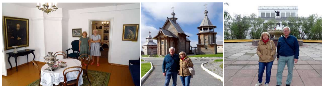
Рис. 3.186. 2019 год. В музее В.И.Сурикова в Красноярске (слева). Салехард (в центре). Воркута (справа)

Выше показана только часть поездок по России. Во всех городах и местах, подписанных на рис. 3.175 мы были. Переходили из Европы в Азию и из Азии в Европу. Переезжали эту границу на поезде и машине. Например, часто ездили на поезде до Екатеринбурга и, далее, на другом поезде, в Приобье через Нижний Тагил, Серов и Ивдель. Я проплыл по Оби весь отрезок от Приобья до Салехарда.